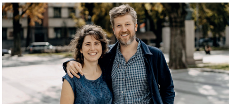
Beiaardduo “Bel Ensemble”

16.30-17.30u Onze-Lieve-Vrouw-over-de-Dijlekerk, Mechelen